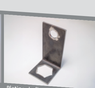
Platine de fixation pour sécuriser les ouvertures des prémurs