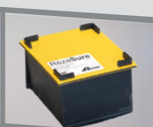
Boîte de réservation Rézasure pour prédalle