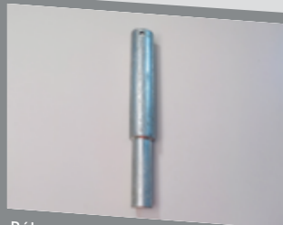
Réhausse pour tubes garde-corps pour prédalle